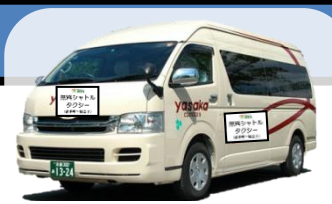
↑ シャトルタクシーのイメージ ※9人乗りジャンボタクシー

◆ 京都マラソン（平成28年2月21日(日)）開催中は、 交通規制等に伴い運休、経路変更する路線バスの代替手段として、 下記の経路・時間において、無料シャトルタクシーを運行いたします。