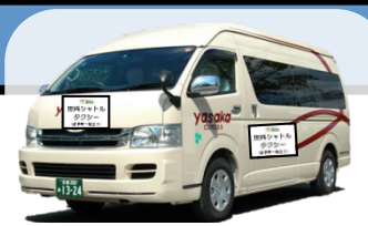
↑ シャトルタクシーのイメージ ※9人乗りジャンボタクシー

◆ 京都マラソン（平成28年2月21日(日)）開催中は、 交通規制等に伴い運休、経路変更する路線バスの代替手段として、 下記の経路・時間において、 無料シャトルタクシー を運行いたします。