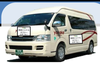
↑ シャトルタクシーのイメージ ※9人乗りジャンボタクシー

◆ 京都マラソン（平成28年2月21日(日)）開催中は、 交通規制等に伴い運休、経路変更する路線バスの代替手段として、 下記の経路・時間において、無料シャトルタクシーを運行いたします。