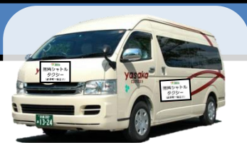
↑ シャトルタクシーのイメージ ※9人乗りジャンボタクシー

◆ 京都マラソン（平成28年2月21日(日)）開催中は、 交通規制等に伴い運休、経路変更する路線バスの代替手段として、 下記の経路・時間において、無料シャトルタクシーを運行いたします。