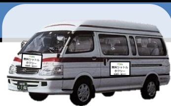
↑ シャトルタクシーのイメージ ※9人乗りジャンボタクシー

◆ 京都マラソン（平成28年2月21日(日)）開催中は、 交通規制等に伴い運休、経路変更する路線バスの代替手段として、 下記の経路・時間において、無料シャトルタクシーを運行いたします。