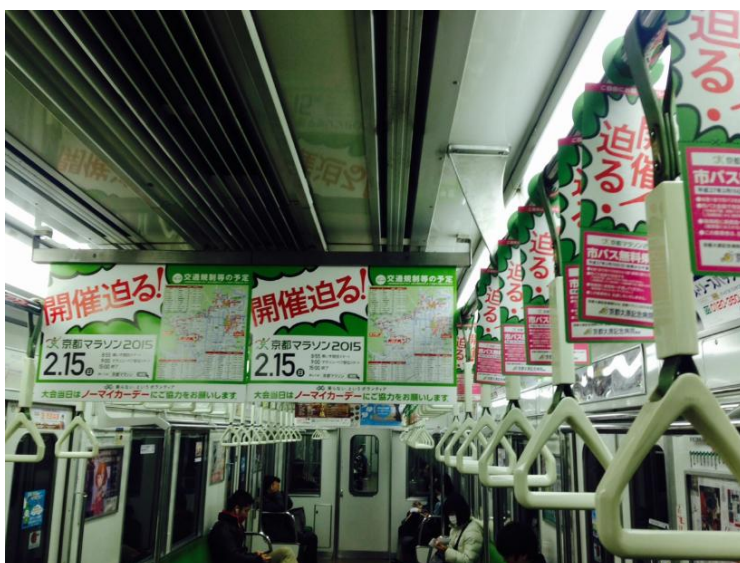
昨年掲出イメージ